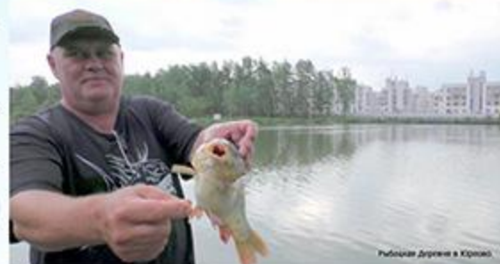
Рыбалка Деген в Криво